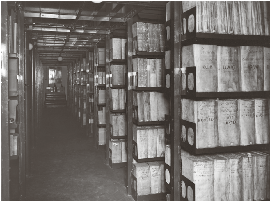
Archiefdepot van het gemeentearchief in de Janskerk, kort na de opening. Foto 1937.